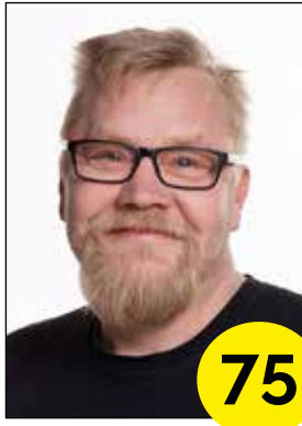
Ojala Sami maanviljelijä, yrittäjä, 47v